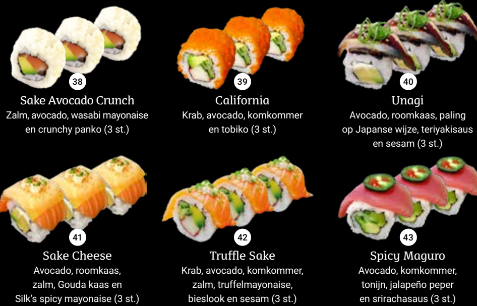
38 Sake Avocado Crunch Zalm, avocado, wasabi mayonaise en crunchy panko (3 st.) 39 California Krab, avocado, komkommer en tobiko (3 st.) 40 Unagi Avocado, roomkaas, paling op Japanse wijze, teriyakisaus en sesam (3 st.) 41 Sake Cheese Avocado, roomkaas, zalm, Gouda kaas en Silk's spicy mayonaise (3 st.) 42 Truffle Sake Krab, avocado, komkommer, zalm, truffelmayonaise, bieslook en sesam (3 st.) 43 Spicy Maguro Avocado, komkommer, tonijn, jalapeño peper en srirachasaus (3 st.)