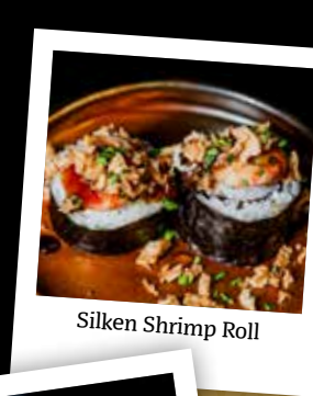
Silken Shrimp Roll