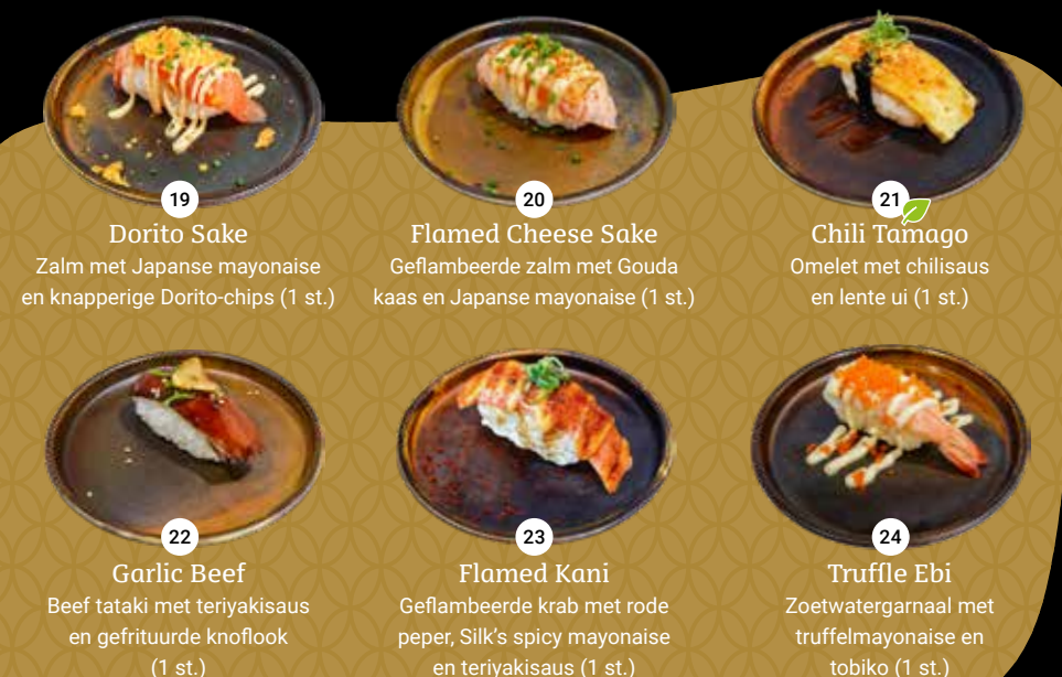
19 Dorito Sake Zalm met Japanese mayonaise en knapperige Dorito-chips (1 st.) 20 Flamed Cheese Sake Geflambeerde zalm met Gouda kaas en Japanese mayonaise (1 st.) 21 Chili Tamago Omelet met chilisaus en lente ui (1 st.) 22 Garlic Beef Beef tataki met teriyakisaus en gefrituurde knoflook (1 st.) 23 Flamed Kani Geflambeerde krab met rode peper, Silk's spicy mayonaise en teriyakisaus (1 st.) 24 Truffle Ebi Zoetwatergarnaal met truffelmayonaise en tobiko (1 st.)