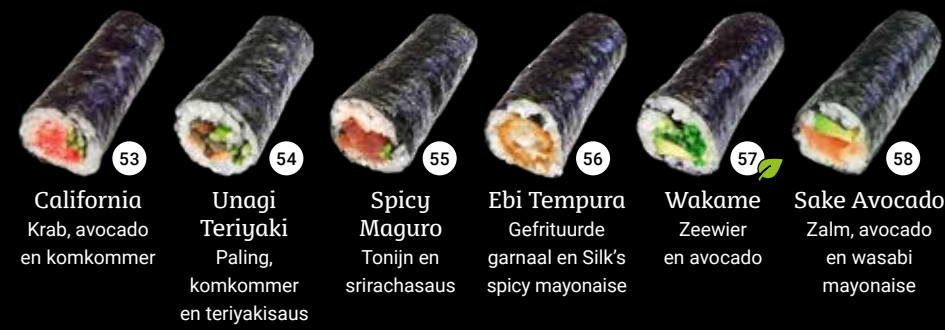
53 California Krab, avocado en komkommer 54 Unagi Teriyaki Paling, komkommer en teriyakisaus 55 Spicy Maguro Tonijn en srirachasaus 56 Ebi Tempura Gefrituurde garnaal en Silk's spicy mayonaise 57 Wakame Zeewier en avocado 58 Sake Avocado Zalm, avocado en wasabi mayonaise