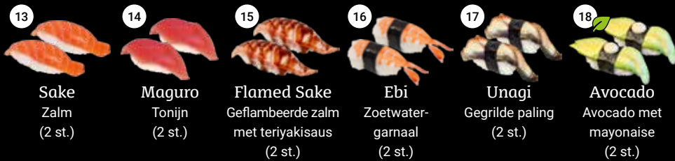
13 Sake Zalm (2 st.) 14 Maguro Tonijn (2 st.) 15 Flamed Sake Geflambeerde zalm met teriyakisaus (2 st.) 16 Ebi Zoetwatergarnaal (2 st.) 17 Unagi Gegrilde paling (2 st.) 18 Avocado Avocado met mayonaise (2 st.)