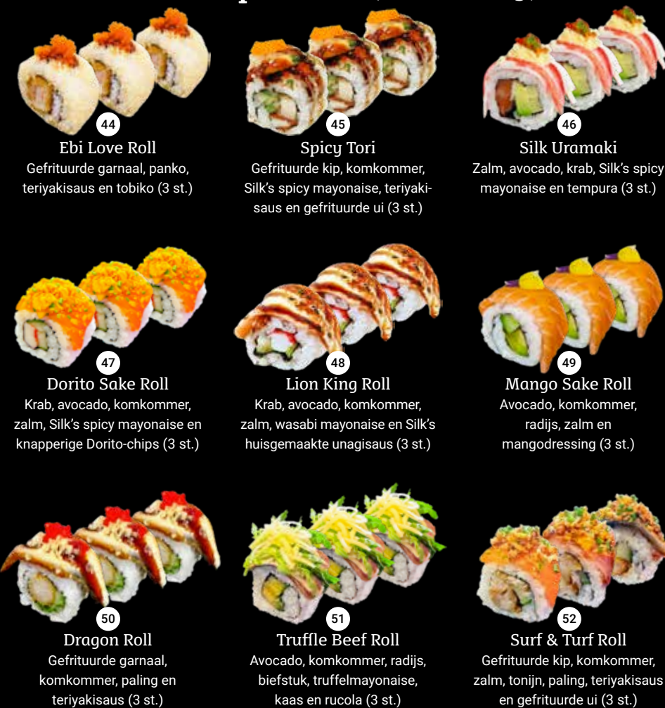
44 Ebi Love Roll Gefrituurde garnaal, panko, teriyakisaus en tobiko (3 st.) 45 Spicy Tori Gefrituurde kip, komkommer, Silk's spicy mayonaise, teriyakisaus en gefrituurde ui (3 st.) 46 Silk Uramaki Zalm, avocado, krab, Silk's spicy mayonaise en tempura (3 st.) 47 Dorito Sake Roll Krab, avocado, komkommer, zalm, Silk's spicy mayonaise en knapperige Dorito-chips (3 st.) 48 Lion King Roll Krab, avocado, komkommer, zalm, wasabi mayonaise en Silk's huisgemaakte unagisaus (3 st.) 49 Mango Sake Roll Avocado, komkommer, radijs, zalm en mangodressing (3 st.) 50 Dragon Roll Gefrituurde garnaal, komkommer, paling en teriyakisaus (3 st.) 51 Truffle Beef Roll Avocado, komkommer, radijs, biefstuk, truffelmayonaise, kaas en rucola (3 st.) 52 Surf & Turf Roll Gefrituurde kip, komkommer, zalm, tonijn, paling, teriyakisaus en gefrituurde ui (3 st.)