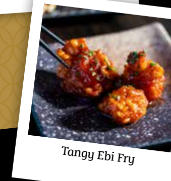
Tangy Ebi Fry