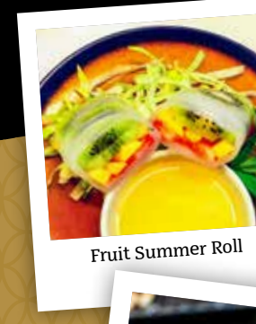
Fruit Summer Roll