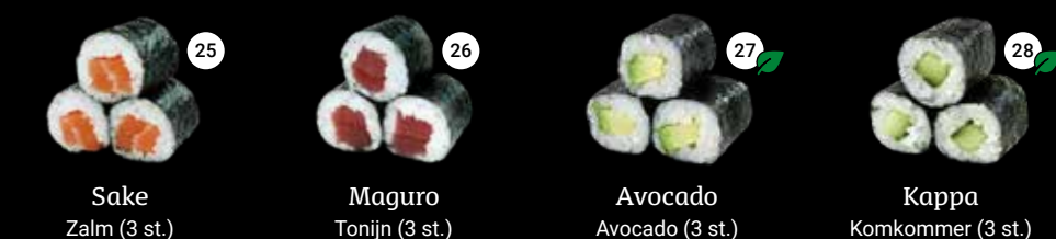
25 Sake Zalm (3 st.) 26 Maguro Tonijn (3 st.) 27 Avocado Avocado (3 st.) 28 Kappa Komkommer (3 st.)