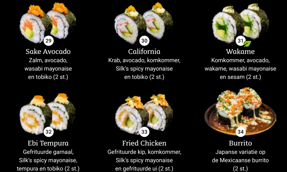
29 Sake Avocado Zalm, avocado, wasabi mayonaise en tobiko (2 st.) 30 California Krab, avocado, komkommer, Silk's spicy mayonaise en tobiko (2 st.) 31 Wakame Komkommer, avocado, wakame, wasabi mayonaise en sesam (2 st.) 32 Ebi Tempura Gefrituurde garnaal, Silk's spicy mayonaise, tempura en tobiko (2 st.) 33 Fried Chicken Gefrituurde kip, komkommer, Silk's spicy mayonaise en gefrituurde ui (2 st.) 34 Burrito Japanse variatie op de Mexicaanse burrito (2 st.)