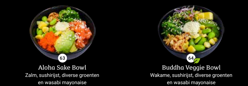
63 Aloha Sake Bowl Zalm, sushirijst, diverse groenten en wasabi mayonaise 64 Buddha Veggie Bowl Wakame, sushirijst, diverse groenten en wasabi mayonaise