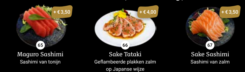
65 Maguro Sashimi Sashimi van tonijn + € 3,50 66 Sake Tataki Geflambeerde plakken zalm op Japanse wijze + € 4,00 67 Sake Sashimi Sashimi van zalm + € 3,50