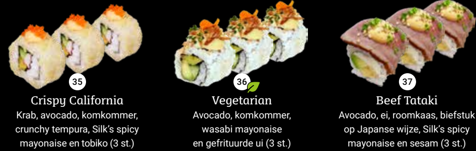
35 Crispy California Krab, avocado, komkommer, crunchy tempura, Silk's spicy mayonaise en tobiko (3 st.) 36 Vegetarian Avocado, komkommer, wasabi mayonaise en gefrituurde ui (3 st.) 37 Beef Tataki Avocado, ei, roomkaas, biefstuk op Japanse wijze, Silk's spicy mayonaise en sesam (3 st.)