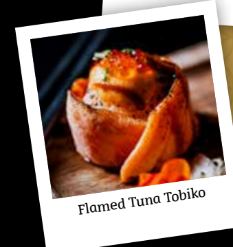
Flamed Tuna Tobiko

68 Chef's Choice Laat u verrassen door onze koks. Iedere maand een nieuw gerecht.