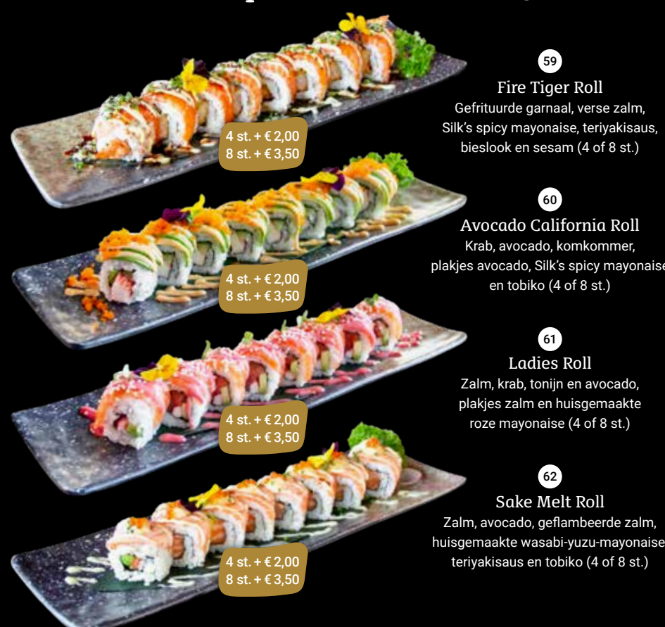
59 Fire Tiger Roll Gefrituurde garnaal, verse zalm, Silk's spicy mayonaise, teriyakisaus, bieslook en sesam (4 of 8 st.) 60 Avocado California Roll Krab, avocado, komkommer, plakjes avocado, Silk's spicy mayonaise en tobiko (4 of 8 st.) 61 Ladies Roll Zalm, krab, tonijn en avocado, plakjes zalm en huisgemaakte roze mayonaise (4 of 8 st.) 62 Sake Melt Roll Zalm, avocado, geflambeerde zalm, huisgemaakte wasabi-yuzu-mayonaise, teriyakisaus en tobiko (4 of 8 st.)