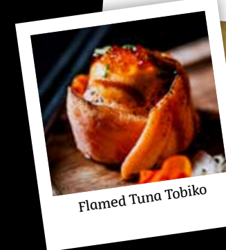
Flamed Tuna Tobiko