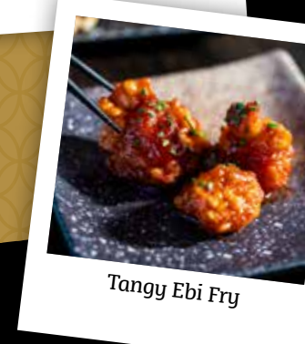
Tangy Ebi Fry