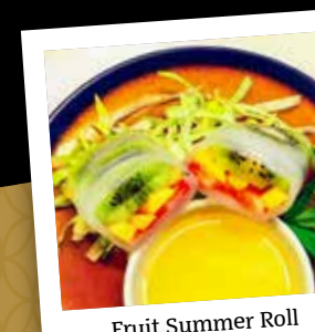
Fruit Summer Roll