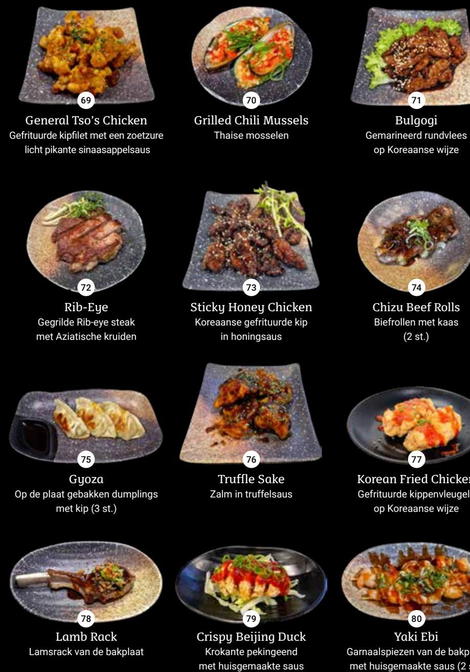
69 General Tso's Chicken Gefrituurde kipfilet met een zoetzure licht pikante sinaasappelsaus 70 Grilled Chili Mussels Thaise mosselen 71 Bulgogi Gemarineerd rundvlees op Koreaanse wijze 72 Rib-Eye Gegrilde Rib-eye steak met Aziatische kruiden 73 Sticky Honey Chicken Koreaanse gefrituurde kip in honingsaus 74 Chizu Beef Rolls Biefrollen met kaas (2 st.) 75 Gyoza Op de plaat gebakken dumplings met kip (3 st.) 76 Truffle Sake Zalm in truffelsaus 77 Korean Fried Chicken Gefrituurde kippenvleugels op Koreaanse wijze 78 Lamb Rack Lamsrack van de bakplaat 79 Crispy Beijing Duck Krokante pekingeend met huisgemaakte saus 80 Yaki Ebi Garnaalesspiezen van de bakplaat met huisgemaakte saus (2 st.)