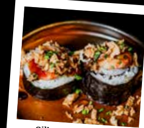
Silken Shrimp Roll