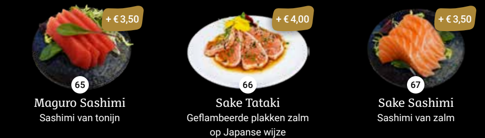
65 Maguro Sashimi Sashimi van tonijn + € 3,50 66 Sake Tataki Geflambeerde plakken zalm op Japanse wijze + € 4,00 67 Sake Sashimi Sashimi van zalm + € 3,50