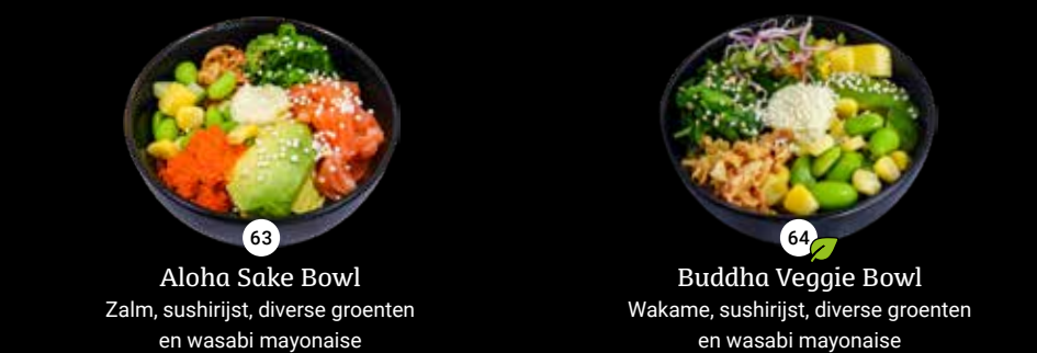
63 Aloha Sake Bowl Zalm, sushirijst, diverse groenten en wasabi mayonaise 64 Buddha Veggie Bowl Wakame, sushirijst, diverse groenten en wasabi mayonaise